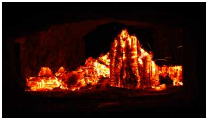
Trochu dřeva a 150 hl vody vře!

Dne 31/8/2010 bylo po 23 letech opět roztopeno pod původní černokosteleckou varnou z roku 1930. Tento pokus proběhl z důvodu zkoušky těsnosti varny, stavu topeniště a všech součástí varní garnitury. V 17.30 voda začala vřít a můžeme směle konstatovat, že varna je v dobrém stavu. Výsledkem tohoto snažení jest pokračování v rekonstrukci varny. Příští týden dojde k instalaci a odzkoušení motorů, převodovek a čerpadel. Přijďte se podívat na prohlídku pivováru, kde Vás zasvětime do dalších podrobností... DEJ BŮH ŠTĚSTÍ