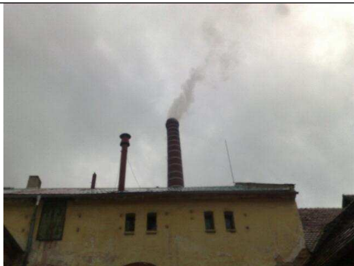
První kouř po 23 letech!